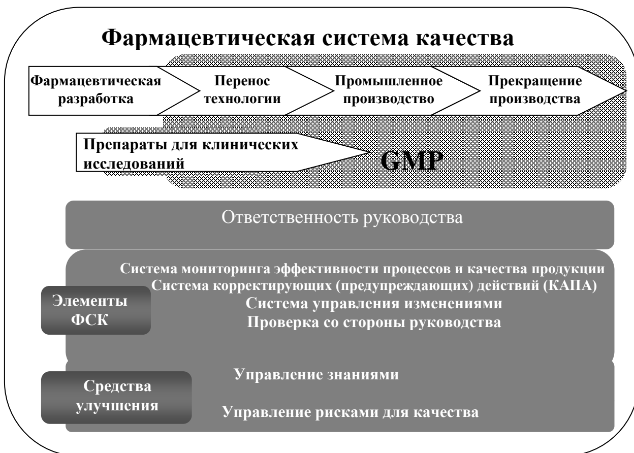
СХЕМА модели фармацевтической системы качества

На схеме показаны основные особенности модели фармацевтической системы качества (далее – ФСК). ФСК охватывает весь жизненный цикл продукции, включая фармацевтическую разработку, перенос технологии, промышленное производство и прекращение производства.